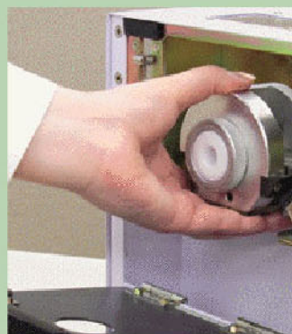
ワンタッチで着脱可能