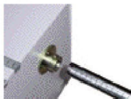
ストッパー : RSK705