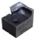
替刃ツール : RSK701