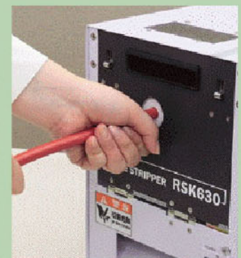
作業方法(フットスイッチ使用)